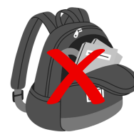
Sac défectueux ou brisé