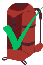
Sac à dos