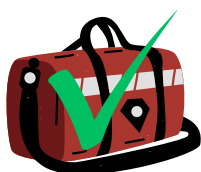
Sac de sport souple